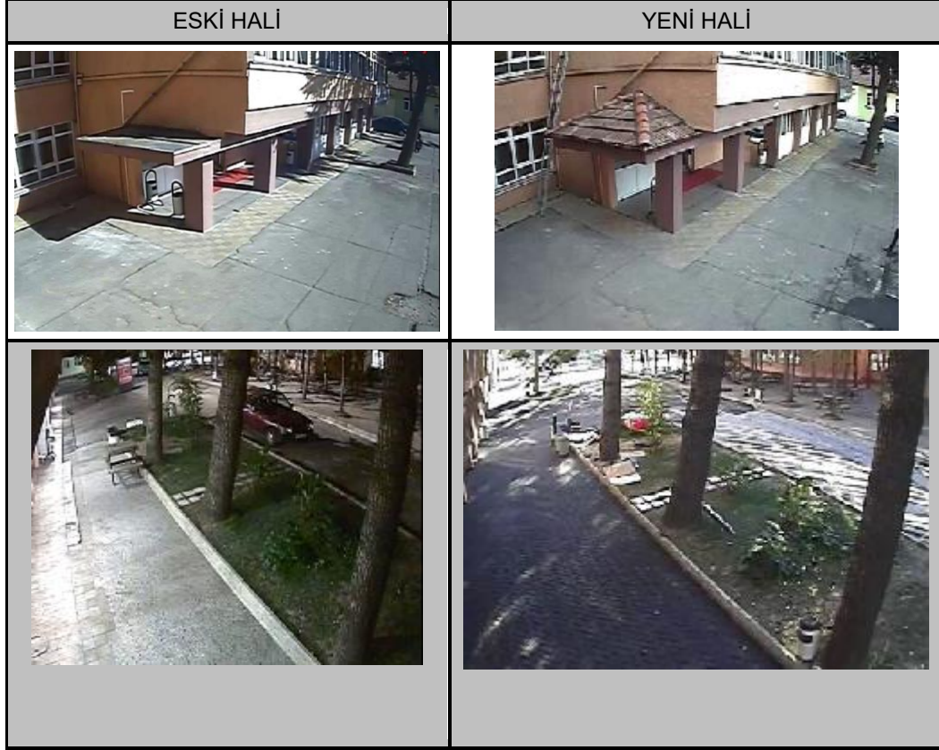
Tablo 1.1.3 Çevre Düzenlemeleri