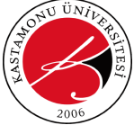
Tablo 1.2. Kastamonu Üniversitesi Kapalı Alanlarının Dağılımı *